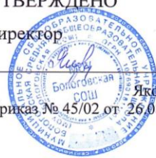
График общественно полезного труда на 2024 – 2025 учебный год

Яковлева Л.В. Приказ № 45/02 от 26.08.2024 г.